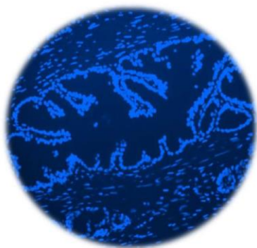
VECTASHIELD with DAPI H-1200